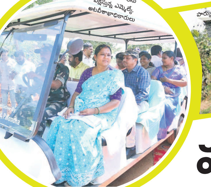
ప్రకృతి అందాలను వీక్షిస్తున్న ఎమ్మెల్యే అటవీశాఖాధికారులు