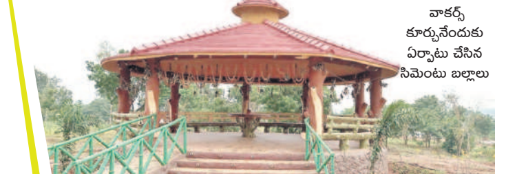
పాకర్స్ కూర్చునేందుకు ఏర్పాటు చేసిన సిమెంట్ బల్కాలు

ఇల్లం దూరంలో, అక్టోబర్ 19: పక్షుల కిలకీలా రావాలి.. రంగు రంగుల సీతాకోకచిలుకల పలకరింపులు.. వేకువ జామున గుట్టను తాకుతున్న మేపూలు.. చెట్ల కొమ్మల రెపరెపలు.. ఆహ్లాదం.. ఆనందం.. అన్నీ ఒకేచోట అనుభూతి చెందే ప్రదేశం ఇల్లం పట్టణ శివారులోని కోదగట్ల (ఊరగట్ల) నేరల్ పార్క్. రాష్ట్ర అటవీశాఖ రూ.1.74 కోట్లతో సుమారు