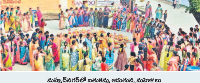
మత్తాడైనగల్లో బతుకమ్మ ఆడుతున్న మహిళలు