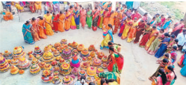
చందూర్ మండలం లక్ష్మణపూర్ లో బతుకమ్మ సంబురాలు