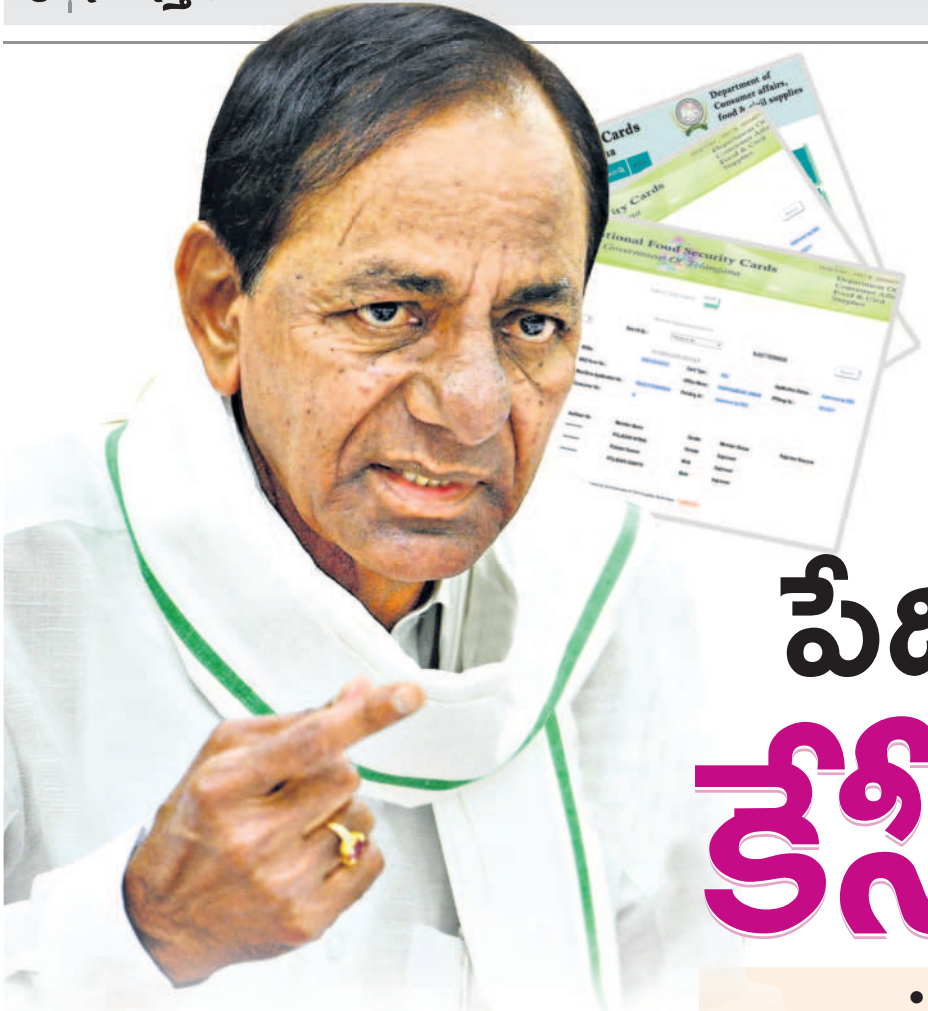
కేసీఆర్ బీమా.. బీమా..

సీఎం కేసీఆర్ బీఆర్ఎస్ మ్యూనిఫెస్టోలో ప్రకటించిన 'కేసీఆర్ బీమా' పథకంపై రాష్ట్రంలో జోరుగా చర్చలుగుతున్నది. రాష్ట్రంలో ఉన్న ప్రతి నిరుపేద కుటుంబానికి బీమా సౌకర్యం కల్పించాలని తాము భావిస్తున్నామని, బీఆర్ఎస్ అధికారంలోకి వచ్చిన తర్వాత వచ్చే ఏడాది జూన్ నుంచి (బీమా సంవత్సరం ప్రారంభం అయ్యే తేదీ) రాష్ట్రంలో ఉన్న 98 లక్షల తెలుగు రంగు రేషన్ కార్డు దారులైన కుటుంబాలన్నింటికీ వర్తింప చేస్తామని ప్రకటించగా, ప్రజల నుంచి విశేష స్పందన వస్తోంది. ఇలాంటి ఆలోచన గతంలో ఏ పార్టీకి, ఏ ప్రభుత్వానికీ రాలేదని, రైతన్నలకు తోలిసారీగా అమలు చేసిన బీమా పథకం అనుభవంతో సీఎం కేసీఆర్ ప్రతి కుటుంబానికి బీమా సౌకర్యం కల్పించడానికి సంకల్పించడం చాలా గొప్ప విషయమంటున్నారు. ఈ పథకం వల్ల ఉమ్మడి కరీంనగర్ జిల్లాలో దాదాపు 10 లక్షల కుటుంబాలకు మేలు జరిగే అవకాశం ఉంది.