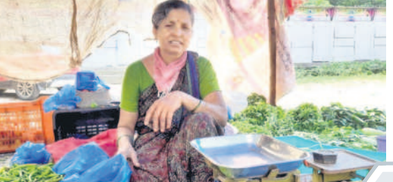
కారాగారులు అమ్మతనూ ఉమాదేవి

రైతన్నలకు అమలు చేస్తున్న మాదిరిగానే కుటుంబాలకు సైతం బీమా సౌకర్యాన్ని కల్పించాలన్నది సీఎం కేసీఆర్ ఆలోచన. ఉమ్మడి కరీంనగర్ జిల్లాలో 9,64,807 తెలుగు రంగు రేషన్ కార్డు దారులున్నారు. జగిత్యాల జిల్లాలో 2,93,042 తెల్ల రేషన్ కార్డులు ఉండగా, ఇందులో 8,49,698 మంది సభ్యులున్నారు. సిరిసిల్ల జిల్లాలో 1,74,050 కుటుంబాలు ఉండగా, 5,00,562 మంది సభ్యులుగా ఉన్నారు. కరీంనగర్ జిల్లాలో 2,78,411 కుటుంబాలు ఉండగా, 8,11,443 మంది సభ్యులుగా ఉన్నారు. ఇక పెద్దపల్లి జిల్లాలో 2,19,304 కార్డులు ఉండగా, 3,83,706 మంది సభ్యులుగా ఉన్నారు. భవిష్యత్తులో కుటుంబ బీమా పథకం పరిధిలోకి ఉమ్మడి జిల్లాలో ఉన్న 9,64,807 కుటుంబాలు వస్తాయి. ఇందులో అర్హులైన వారందరికీ బీమా సౌకర్యం వర్తిస్తుంది.