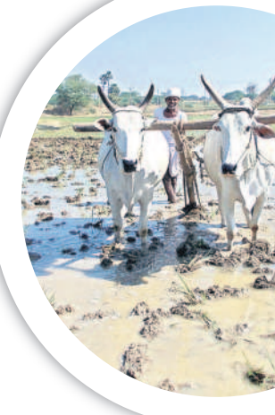
కారాగారులు అమ్మతనూ ఉమాదేవి

ఉమ్మడి కరీంనగర్ జిల్లా పరిధిలో ఇప్పటివరకు 4,48,325 మందికి రైతు బీమా సౌకర్యాన్ని ప్రభుత్వం కల్పించింది. ఐదేండ్లుగా ఈ పథకాన్ని రాష్ట్ర ప్రభుత్వం అమలు చేస్తున్న విషయం తెలిసింది. 18 ఏండ్ల నుంచి 59 ఏండ్ల మధ్య వయసులో ఉన్న పట్టాదారులైన రైతులందరూ బీమా పరిధిలోకి వస్తున్నారు. వీరికి సంబంధించిన బీమా ప్రీమియం ఏటా ప్రభుత్వమే చెల్లిస్తోంది. పట్టాదారుడైన రైతు ప్రమాదవశాత్తు లేదా ఇతర ఏ కారణాలతోనైనా మృత్యువాత పడితే అతడి కుటుంబ సభ్యులకు పదిరోజుల వ్యవధిలో బీమాకు సంబంధించిన రూ.5లక్షలు అందేలా చేస్తోంది. పథకం అమలులోకి వచ్చిన ఈ ఐదేండ్లలోనే పదివేలకు పైగా మృతిచెందిన రైతుల కుటుంబాలకు ప్రయోజనం కలిగింది.