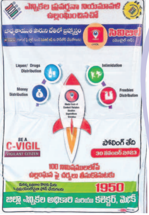
కలెక్టర్ కార్యాలయంలో ఏర్పాటు చేసిన గోడపత్రిక