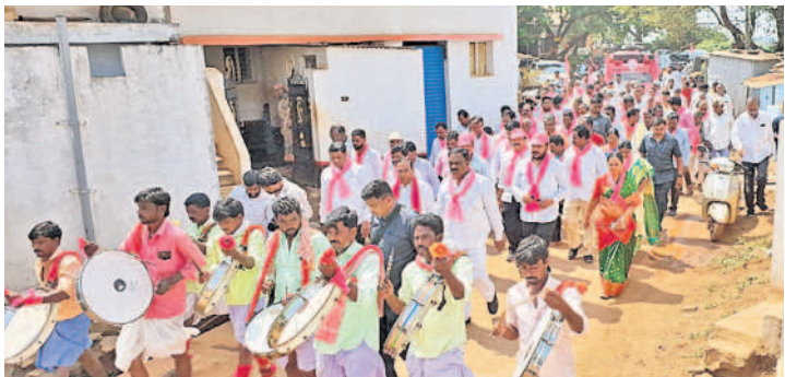
డప్పు చప్పళ్లతో గొటిగారపల్లిలో ర్యాలీ నిర్వహిస్తున్న బీఆర్ఎస్ శ్రేణులు