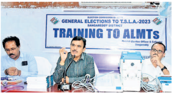
సమావేశంలో మాట్లాడుతున్న జిల్లా ఎన్నికల అధికారి, కలెక్టర్ డాక్టర్ శరత్