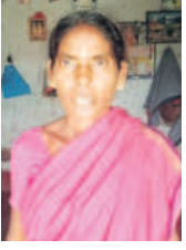
- జంబుగ పాంస, సోదర్

సోదర్, అక్టోబర్ 19 : ముఖ్య మంత్రి కేసీఆర్ రూ.200 ఉన్న పెన్షన్‌ను రూ.2,018కు పెంచి మూలాంటి గరిబోళ్ళను ఆదుకుంటున్నాడు. ఎన్నికల్లో గెలిచిన తర్వాత మళ్ళీ మరో వెయ్యి పెంచి రూ.3,018 చేయనున్నట్లు చెప్పడంతో సంతోషం కలిగింది. యేటా రూ. 500 పెంచుతూ రూ.5 వేల వరకు చేస్తాననడంతో మూలాంటి మధ్య తరగతి కుటుంబాలకు భరోసా ఇచ్చినట్లయింది.