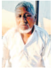
- బొడ్డు రాములు, వృద్ధులు, సరికొండ

ఇవ్వడం, అక్టోబర్ 19 : నా ఆసాంటి ముసలివాళ్ళ వయసు పెరగడంతో ఎటువంటి పనిచేయ కంట ఇంటికాడ ఉండడంతో పాటు వృద్ధాప్యంలో వ్యాధుల బాధని పడుతున్నారు. దీనిని మోడి కల్ ఖర్చు బాగా అవుతున్నది. గత ప్రభుత్వాలు తక్కువ పింఛన్లు అందించాయి. ఇవి ఎటు సరిపోలేదు. తెలంగాణ ప్రభుత్వం వచ్చిన తర్వాత రూ.2,016 నుంచి దశలవారీగా రూ.5,016 పెంచుతామని ప్రకటించడం సంతోషం. మా సోదరి ముసలివాళ్ళకు అల్లక భారం తగ్గుతది.