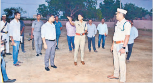
చిట్టాల వద్ద ఉన్న గోదాం పరిసరాలను పరిశీలిస్తున్న కలెక్టర్, ఎస్పీ