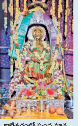
కాళేశ్వరంలో స్కంద మాత అలంకరణలో పాల్గొంటున్న