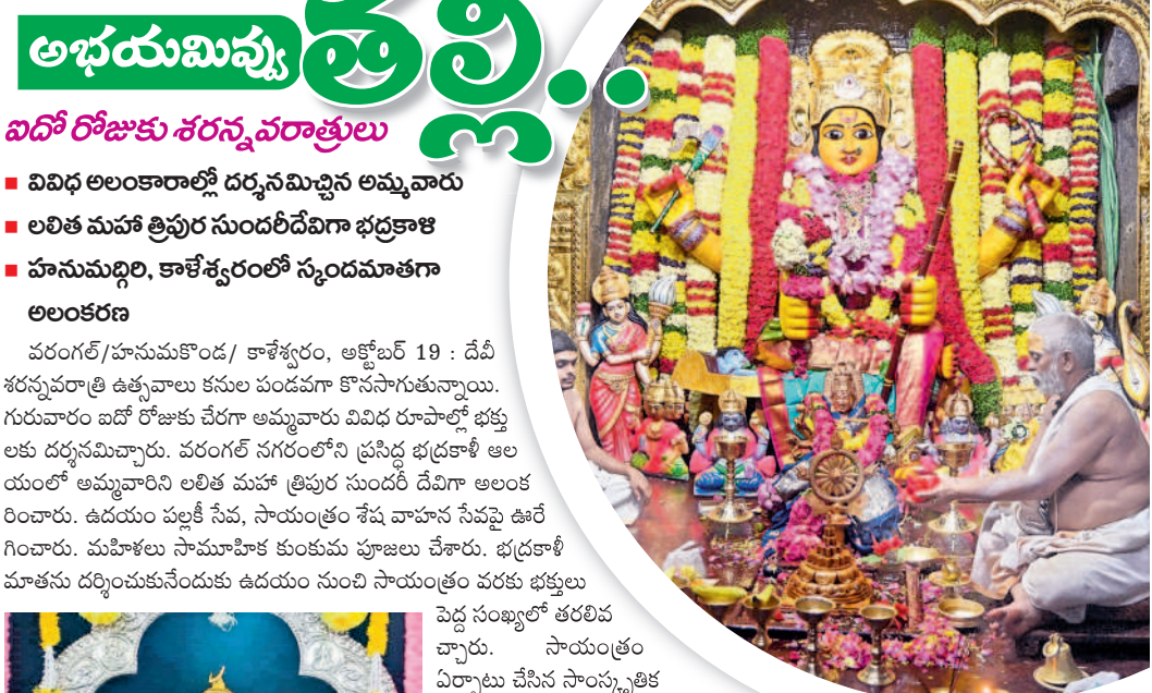
లలితా మహా త్రిపుర సుందరీ దేవి ఆలయంలో భద్రకాళీ అమ్మవారు