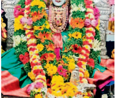
లలితాదేవి ఆలయంలో రాజరాజేశ్వరీ దేవి