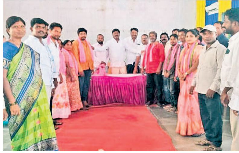
నర్సంపేటలోని 23వ వార్డులో ఎమ్మెల్యే పెద్ది నమక్షంలో బీఆర్ఎస్ లో చేరిన కాంగ్రెస్ కార్యకర్తలు