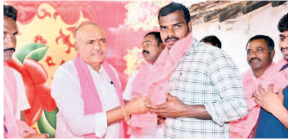
గణపూరు: బీఆర్ఎస్ లో చేరిన పరశురాంపల్లి గ్రామానికి చెందిన బీజేపీ, కాంగ్రెస్ యూత్ కార్యకర్తలను ఆహ్వానిస్తున్న ఎమ్మెల్యే గండ్ల