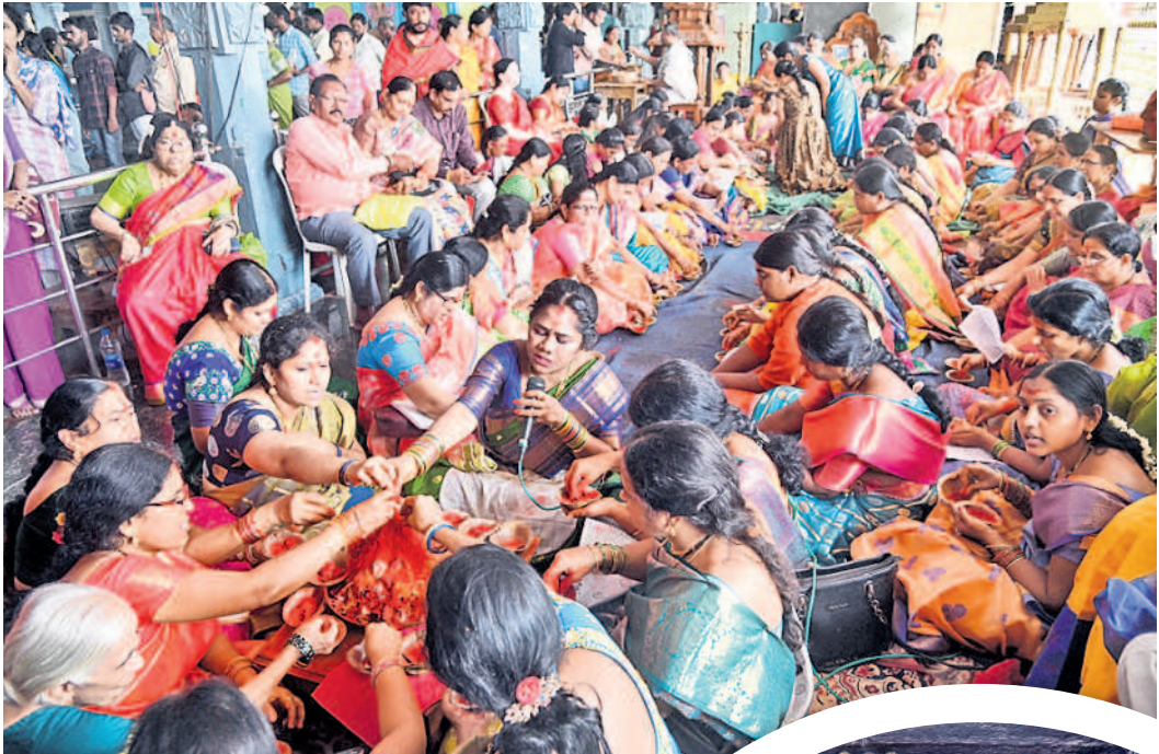
భద్రకాళీ ఆలయంలో సామాహిక కుంకుమ పూజలు చేస్తున్న మహిళలు