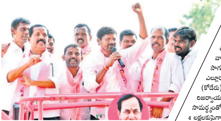
అవ్రాబాద్ ఎన్నికల ప్రచారంలో మాట్లాడుతున్న ప్రభుత్వ విప్, ఎమ్మెల్యే గువ్వల బాలరాజు