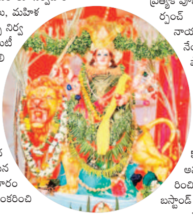
నర్సలో అన్నపూర్ణాదేవీ లలంకరణలో..