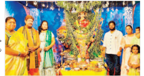
అత్తూర్లో అమ్మవారికి పూజలు చేస్తున్న భక్తులు

చారు. కార్యక్రమంలో అయా గ్రామాల నిర్వాహకులు, గ్రామ పెద్దలు, మహిళలు, భజనసమంధరి సభ్యులు తదితరులు పాల్గొన్నారు. శాకాంబరీ దేవీగా... అత్యుత్తమ, అక్టోబర్ 19: మండల కేంద్రంలో స్వర్ణకారం ఘం అధ్యక్షులలో నీలకంఠేశ్వరస్వామి ఆలయంలో ఏర్పాటుచేసిన మండపంలో దుర్గాదేవిని గురువారం శాకాంబరీ దేవీగా అలంకరించి ప్రత్యేక పూజలు నిర్వహించారు. వాసవీ కన్యకాపరమేశ్వరి ఆలయంలో అమ్మవారు పార్వతీ దేవీ రూపంలో భక్తులకు దర్శనమిచ్చారు. హనుమాన్ నగర్ స్పటిక లింగేశ్వరస్వామి ఆలయంలో ఏర్పాటుచేసిన మండపంలో అమ్మవారు మహాలక్ష్మి రూపంలో దర్శనమిచ్చారు. కోట్ల ఆంజనేయస్వామి ఆలయం, మల్లాపురం ఆంజనేయస్వామి ఆలయం