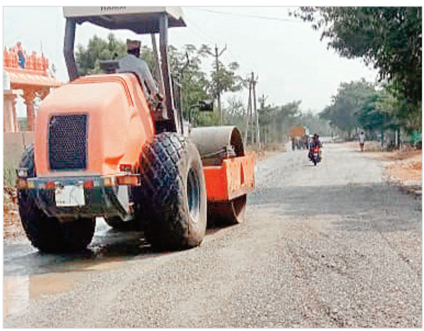
కొనసాగుతున్న మాస్టీపూర్, కృష్ణంపల్లి రోడ్డు పనులు

అన్లైన్ ద్వారా టెండర్ల పలికి పనుల్లో వేగం పెంచేలా చేశారు. దీంతో మొదటి విడుదలలో మాస్టీపూర్ క్రాస్ రోడ్డు, మాస్టీపూర్ వరకు మూడు కిలోమీటర్ల వరకు రోడ్డు పనులు పూర్తి చేశారు. రెండో విడుదలలో మాస్టీపూర్ నుంచి కృష్ణంపల్లి వరకు రూ.3 కోట్లతో చేపట్టిన రోడ్డు పనులు మరో వారం రోజుల్లో పూర్తి అయ్యేలా శరవేగంగా కొనసాగుతున్నాయి. దీంతో మాస్టీపూర్, సందిమల్ల, చంద్రపూర్, కృష్ణంపల్లి, నందిమల్ల ఎక్స్ ప్రెస్ రోడ్డు తో పాటు జూరాల ప్రాజెక్టు మీదుగా గద్వాల, రాయి