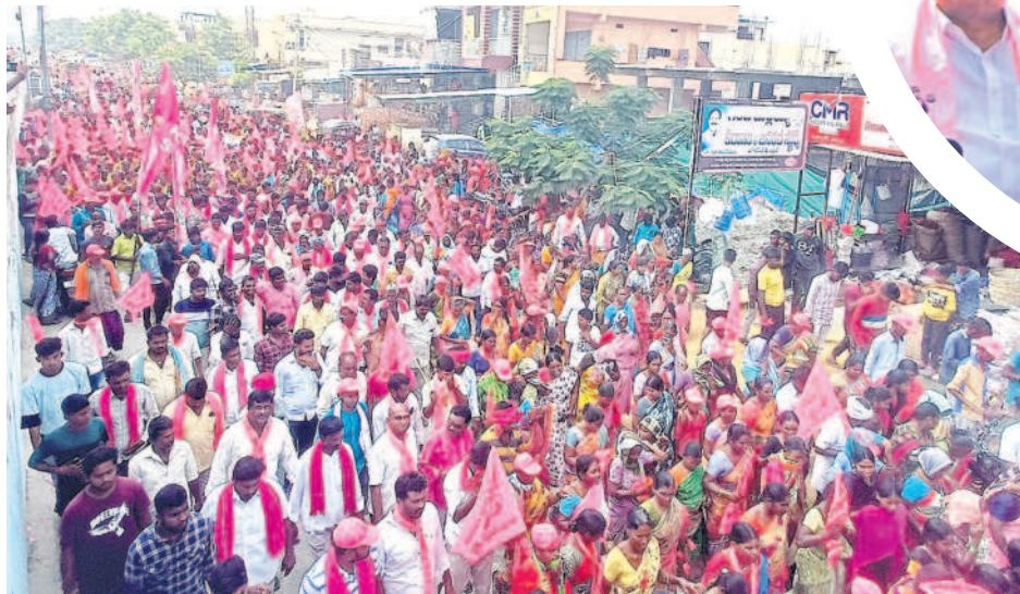
కట్టంగూర్ : బీఆర్ఎస్ ప్రచారంలో పెద్ద ఎత్తున పాల్గొన్న పార్టీ శ్రేణులు, ప్రజలు

అభివృద్ధిని అడ్డుకునేందుకు కాంగ్రెస్, బీజేపీ అడ్డదారులు