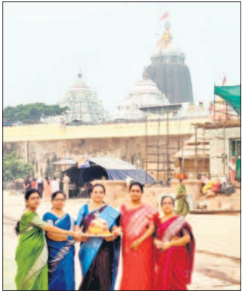
పూరి జగన్నాథ్ ఆలయం ఆవరణలో బతుకమ్మతో తెలంగాణ మహిళలు

వేములవాడ, అక్టోబర్ 19: ఒడిస్సా రాష్ట్రంలోని పూరి జగన్నాథ్ ఆలయంలో తెలంగాణ మహిళలు బతుకమ్మ సంబరాలు ఘనంగా నిర్వహించారు. వేములవాడ ప్రాధ్యక్షులు అనుమం శిశు కుటుంబాలు ఒడిస్సా రాష్ట్రంలో ఆలయాల సందర్శనకు వెళ్లారు. కగా గురువారం పూరి జగన్నాథ్ స్వామి ఆలయ ఆవరణలో