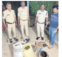
బెల్లం పానకం, ఇప్పపువ్వును పరిశీలిస్తున్న ఎన్ఐఐ