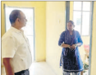
రుద్రవరంలోని పల్లె దవాఖానను పరిశీలిస్తున్న డి.ఎం.హెచ్.ఎస్. జిల్లా వైద్యాధికారి