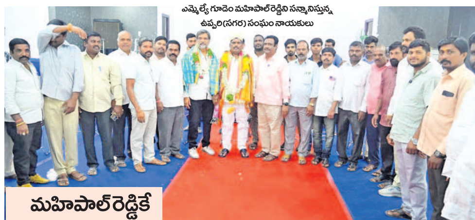
ఎమ్మెల్యే గూడెం మహిపాల్ రెడ్డిని సన్మానిస్తున్న ఉప్పలి (సంగర) సంఘం నాయకులు

-సంగారెడ్డి, అక్టోబర్ 19 (నమస్తే తెలంగాణ)