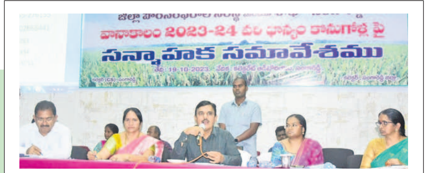
సమావేశంలో మాట్లాడుతున్న జిల్లా ఎన్నికల అధికారి, కలెక్టర్ డాక్టర్ శరత్