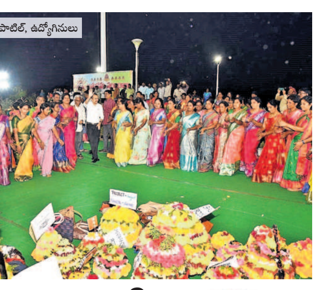
బతుకమ్మతో అదనపు కలెక్టర్ గౌరవం అగర్వాల