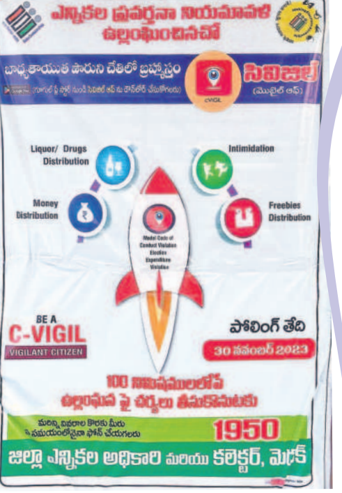
కలెక్టర్ కార్యాలయంలో ఏర్పాటు చేసిన గోడపత్రిక