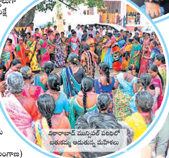
వికారాబాద్ మున్సిపల్ పరిధిలో బతుకమ్మ ఆడుతున్న మహిళలు