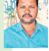
కారు చెన్నయ్య, బోడంపహాద్, షాబాద్

పేదలకు కడుపునిండా అన్నం పెట్టేందుకు సీఎం కేసీఆర్ సన్న బిడ్డయ్యామని పంపిణీ చేస్తామని ఎన్నికల మ్యూనిసిపల్ కార్పొరేషన్ ప్రకటించడం సంతోషకరం. ఇప్పటికే రేషన్ కార్డులో ఎంతమంది ఉంటే అంత మందికి ఒక్కొక్కరికీ ఆరు కిలోల చొప్పున బిడ్డయ్యామని అందిస్తున్న ప్రభుత్వం... మళ్లీ అధికారంలోకి రాగానే అన్నపూర్ణ పథకం ద్వారా ప్రతి కుటుంబానికీ సన్న బిడ్డయ్యామని పంపిణీ చేస్తామని చెప్పడం హద్దనీయం. ఎప్పుడూ సీఎం కేసీఆర్ వెంటే ఉంటా.