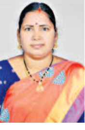
చెరుకూరి మంగ, పోలవరపల్లి, ఇల్లంపల్లి, రంగారావు

సీఎం కేసీఆర్ అన్ని ప్రాంతాల అభివృద్ధికి ఎంతో కృషి చేస్తున్నారు. ఇంటింటికీ ప్రభుత్వ పథకాలను అందిస్తున్నారు. అంతేకాకుండా రానున్న ఎన్నికల్లో గెలిచిన వెంటనే పేదలకు సన్న బిడ్డయ్యామని ప్రకటించడం మ్యూనిసిపల్ కార్పొరేషన్ ప్రకటించడం సంతోషకరం. సన్న బిడ్డయ్యామని పంపిణీ చేస్తామని ప్రకటించడంతో ప్రజలు సంతోషం వ్యక్తం చేస్తున్నారు.