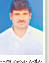
అదిరెడ్డి, దేవినాలపల్లి గ్రామం, చేపల్లె

రేషన్ కార్డులన్నీ సన్న బియ్యం ఇస్తామని సీఎం కేసీఆర్ బీఆర్ఎస్ పార్టీ మ్యూనిసిపల్ కార్పొరేషన్ ప్రకటించడం పేదలకు వరం లాంటిది. పేదలంతా నిజమైన సన్న బిడ్డయ్యింది అంటే పేదలకు భోజనం చేయాలనేది సీఎం కేసీఆర్ ఆలోచన. ఇది పేదల ప్రభుత్వం. ఆయనకు తెలంగాణ ప్రజాసేవ అండగా నిలువాలి. రాష్ట్రాభివృద్ధికి ఆయన ఎంతగానో కృషి చేస్తున్నారు. ఇంటింటికీ ప్రభుత్వ సంక్షేమ పథకాలను అందిస్తున్నారు. ప్రజలంతా సీఎం కేసీఆర్ కు ఓటు వేస్తేనే అన్ని కల్లోల భారీ మెజారిటీ బీఆర్ఎస్ గెలిపించుకోవాలి.