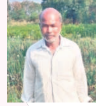
బుద్ధయ్య, బీకులపల్లి, మోహన్ పేట

అన్నపూర్ణ పథకం పేదల పాలిట వరంగా మారవచ్చు. సీఎం కేసీఆర్ పార్టీ మ్యూనిసిపల్ కార్పొరేషన్ గెలిచిన వెంటనే పేదలకు సన్న బిడ్డయ్యామని పంపిణీ చేస్తామని ప్రకటించడం సంతోషకరం. ఇప్పటికే ఆయన పేదలకు ఒక్కొక్కరికీ ఆరు కిలోల చొప్పున సరఫరా చేస్తున్నారు. రాష్ట్రాభివృద్ధికి కృషి చేస్తున్న సీఎం కేసీఆర్ కే నా ఓటు.