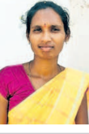
సుబ్రహ్మణ్య, గుమ్మాణి రాంపూర్ తలకొండపల్లి

తనలో జరుగనున్న ఎన్నికల్లో గెలిచిన వెంటనే రేషన్ షాపుల ద్వారా పేదలకు సన్న బిడ్డయ్యింది అంటే చేస్తామని సీఎం కేసీఆర్ పార్టీ మ్యూనిసిపల్ కార్పొరేషన్ ప్రకటించడం చాలా సంతోషకరం. దీని ద్వారా పేదలకు ఆర్థిక భారం తప్పుతుంది. తనలో జరుగనున్న ఎన్నికల్లోనూ కేసీఆర్ కి ఓటు వేసి భారీ మెజారిటీ గెలిపించుకుంటాం.