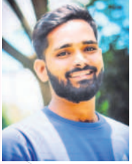
అలర్, షాద్ నగర్

సీఎం కేసీఆర్ అన్ని వర్గాల అభ్యున్నతికి ఎంతో కృషి చేస్తున్నారు. పేదలకు సన్న బిడ్డయ్యామని అందించాలని నిర్ణయించడం చాలా సంతోషకరం. పేద, మధ్యతరగతి ధనికులు అనే తేడాలు లేకుండా అందరికీ న్యాయం జరిగేలా పథకాలకు శ్రీకారం చుట్టడం గొప్ప విషయం.