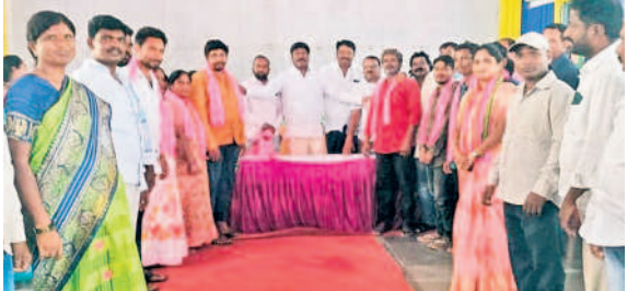
నర్సంపేటలోని 23వ వార్డులో ఎమ్మెల్యే పెద్ది సమక్షంలో బీఆర్ఎస్లో చేరిన కాంగ్రెస్ కార్యకర్తలు