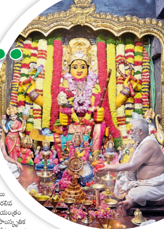
అలితా మహా త్రిపుర సుందరీ దేవి అలంకారంలో భద్రకాళీ అమ్మవారు