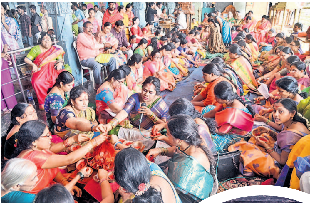
భద్రకాళీ ఆలయంలో సామాహిక కుంకుమ పూజలు చేస్తున్న మహిళలు