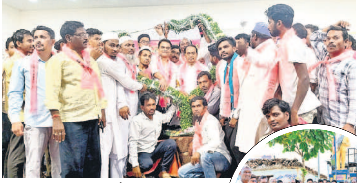
దిలావర్ పూర్: సిర్కారులో మంత్రి ఇంద్రకాంత్ రెడ్డిని గణమాలుతో సన్మానిస్తున్న నాయకులు

అన్ని వర్గాల సంక్షేమమే ద్యేయంగా పాలన సాగిస్తున్న రాష్ట్ర సర్కారు, ఇటీవల విడుదల చేసిన మ్యూనిసిపాలిటీలో మరో విప్లవాత్మక హామీనిచ్చింది. వచ్చే ఎన్నికల్లో బీఆర్ఎస్ గెలిస్తే తెల్ల రేషన్ కార్డులున్న కుటుంబాలన్నింటికీ సన్న బియ్యం పంపిణీ చేస్తామని ప్రకటించింది. ఇప్పటికే గురుకులాలు, ప్రభుత్వ పాఠశాలల్లో సన్నన్నం పెడుతుండగా, తాజా నిర్ణయంతో గరిబోనికి కడుపునిండా భోజనం అందనున్నది. ఉమ్మడి జిల్లాలో 7.46 లక్షల కుటుంబాలకు ప్రయోజనం చేకూరే అవకాశముండగా, సర్వత్రా హర్షం వ్యక్తమవుతున్నది. - మంచుర్యాల, అక్టోబర్ 20 (నమస్తే తెలంగాణ ప్రతినిధి)