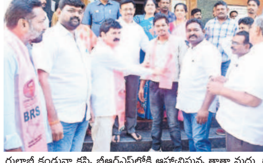
గులాబీ కండువా కప్పి బీఆర్ఎస్లోకి ఆహ్వానిస్తున్న తాతా మధు, డాక్టర్ తెల్లం