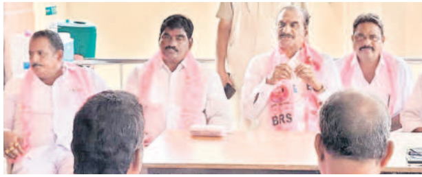
పాల్వంచలో జరిగిన సమావేశంలో మాట్లాడుతున్న కొత్తగూడెం ఎమ్మెల్యే వనమా