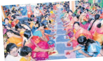
కుంకుమార్చనలో పాల్గొన్న మహిళలు

శరన్నవరాత్రి ఉత్సవాలలో భాగంగా గద్యాల జిల్లా కేంద్రంలోని రాజబీబి వాసవీ కన్యకాపరమేశ్వరి ఆలయంలో అమ్మవారిని రూ.1.11.11.111 నోట్లతో అలంకరించారు. అదేవిధంగా అమ్మవారికి విశిష్ట పూజలు నిర్వహించారు. సాయంత్రం మహిళలు అధిక సంఖ్యలో పాల్గొని కుంకుమార్చన చేశారు. - గద్యాల టౌన్, అక్టోబర్ 20