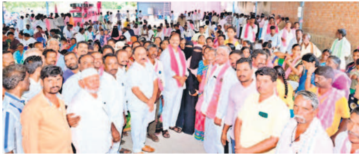
ఎమ్మెల్యే సమక్షంలో జిల్లాలో చేరుతున్న మేకలసాంపల్లికి చెందిన కార్యకర్తలు

• ప్రజలు అలోచించి ఓటు వేయాలి: ఎమ్మెల్యే బండ్ల కృష్ణమోహన్ రెడ్డి