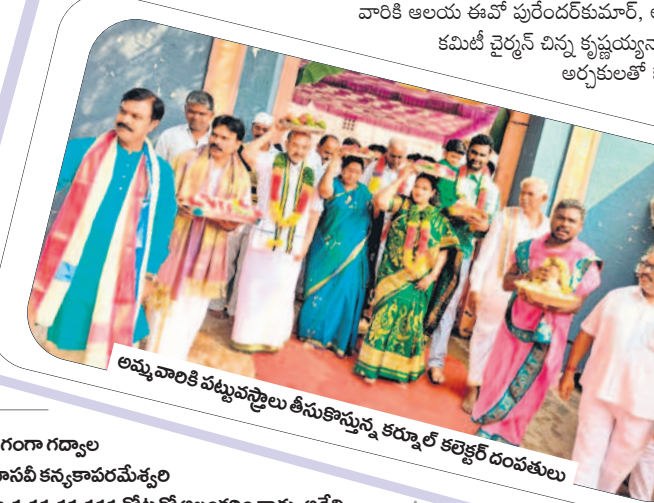
అమ్మవారికి పట్టుపస్త్రాల తీసుకొస్తున్న కర్నూల్ కలెక్టర్ దంపతులు