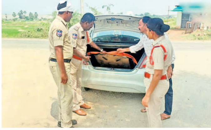
ధర్మకల్ పట్టణంలో ఎస్పీ, బీసీ కాలనీ చెక్ పోస్టు వద్ద వాహనాలను తనిఖీ చేస్తున్న పోలీసులు