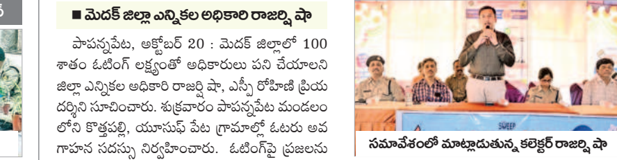
సమావేశంలో మాట్లాడుతున్న కలెక్టర్ రాజ్య షా

■ మెడక్ జిల్లా ఎన్నికల అధికారి రాజ్య షా పాపన్నపేట, అక్టోబర్ 20 : మెడక్ జిల్లాలో 100 శాతం ఓటింగ్ లక్ష్యంతో అధికారులు పని చేయాలని జిల్లా ఎన్నికల అధికారి రాజ్య షా, ఎస్సీ రోహిణి ప్రియ దర్శిని సూచించారు. శుభవారం పాపన్నపేట మండలంలోని కొత్తపల్లి, యూసుపేట పేట గ్రామాల్లో ఓటరు అవగాహన సదస్సు నిర్వహించారు. ఓటింగ్ పై ప్రజలను చైతన్యం చేయాలని అధికారులను జిల్లా ఎన్నికల అధికారి రాజ్య షా ఆదేశించారు. ఓటర్లు తమ ఓటు హక్కును స్వేచ్ఛగా ఉపయోగించుకోవాలన్నారు. ప్రలోభాలకు గురికావద్దని, దేశాన్ని ప్రభావితం చేసే శక్తి ఓటు కే ఉన్నదన్నారు. ఈ నెల 31లోగా అర్జులందరూ ఓటరుగా పేర్లను నమోదు చేసుకోవాలని సూచించారు. గతంలో ఓటింగ్ లో మెడక్ జిల్లా 93 స్థానంలో ఉన్నదని, ప్రస్తుతం మొదటి స్థానంలో ఉండాలని కోరారు. నవంబర్ 10 నుంచి 25 వరకు ఓటరు గుర్తింపు పత్రాలు అందజేస్తామన్నారు. ఎవైనా సందేహాలు ఉంటే స్థానిక ఎన్నికల అధికారిని సంప్రదించాలని సూచించారు.