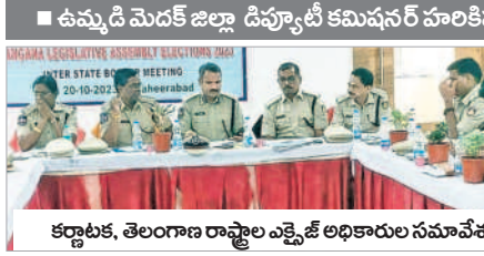
కర్ణాటక, తెలంగాణ రాష్ట్రాల ఎక్స్ ట్రా అధికారుల సమావేశం