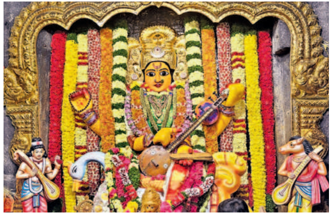
సరస్వతీ మాతా అలంకరణలో భక్తులకు దర్శనమిస్తున్న భద్రకాళీ అమ్మవారు