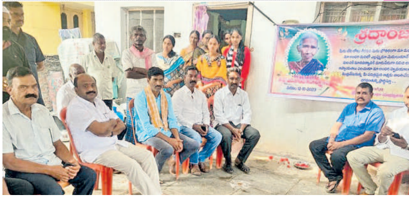
ఆత్మకూరులో బాధిత కుటుంబాన్ని పరామర్శిస్తున్న ఎమ్మెల్యే చల్లా ధర్మాజీ