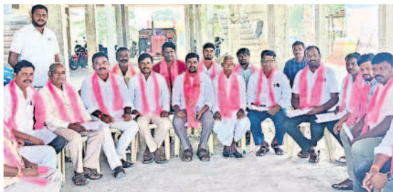
నాగారం : సమావేశంలో మాట్లాడుతున్న బీఆర్ఎస్ మండలాధ్యక్షుడు ఉప్పలయ్య