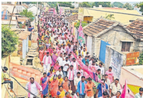
మిర్యాల గ్రామంలో ప్రచారానికి హాజరైన గ్రామస్థులు