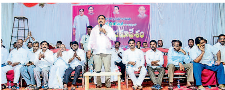
ఊరూరులో నిర్వహించిన డైవింగ్ స్కూల్స్ ఓన్లీ ఆఫీస్ సమ్మేళనంలో మాట్లాడుతున్న మంత్రి ఎర్రబెల్లి దయాకర్ రావు