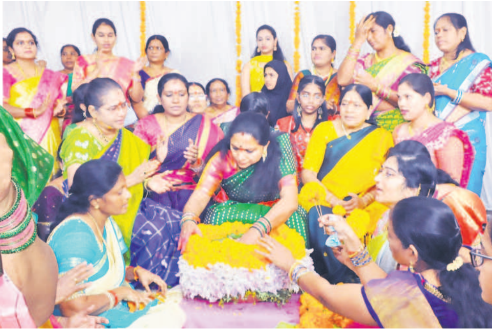
కోరుట్లలో బాల నర్తయ్య ఇంటిలో బతుకమ్మ పేర్చుతున్న ఎమ్మెల్యే కల్యాణకుంట్ల కవిత