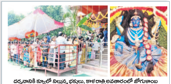
దర్శనానికి క్యూలో నిల్చున్న భక్తులు, కాళరాత్రి అవతారంలో జోగుళాంబ