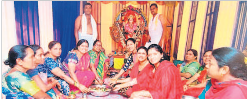
సంతోషనగర్లో అమ్మవారికి పూజలు చేస్తున్న భక్తులు