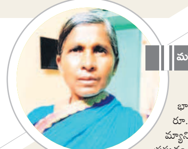
మహిళా వ్యవస్థాపి సీఎం కేసీఆర్

-చిట్టెమ్మ, గృహిణి, తెల్లారాజ్ పల్లి తండ్రా