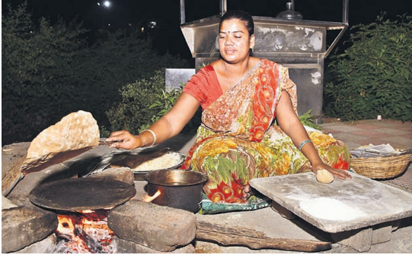
మహిళాబేనగర్ జిల్లా కేంద్రంలోని రూరల్ పోలీస్ స్టేషన్ సమీపంలో కట్టల పాయింట్ డాక్ట్రీలు కాలస్తున్న మహిళ

మహిళాబేనగర్, అక్టోబర్ 21 (నమస్తే తెలంగాణ ప్రతినది) : కేంద్ర ప్రభుత్వం వేదలకు సిలిండర్ అంద కుండా చేసింది. తొమ్మిదిన్నర ఏళ్ల కాలంలో సిలిండర్ ధర ఒకే సారి మూడింతలు పెంచింది. దీని బంధజడ గ్యాస్ అంటేనే భయపడేలా చేసింది. ప్రతిసారి గ్యాస్, పెట్రోల్ ధరలు పెంచుతూ సామాన్యుల నడ్డి విరిచింది. వంట గ్యాస్ ధరలు అమాంతంగా పెరగడంతో గ్రామీణ ప్రాంతాల్లో మళ్లీ కట్టలపాయింట్లు అంటుకుంటున్నాయి. ఎన్నిసార్లు విషకాలు మొత్తుకున్నా మోడీ కనికరించలేదు. మహిళలు రోడ్లెక్కినా ఫలితం వేరే దాపోయింది. అధికారంలో వచ్చే నాటికి రూ.400 ఉన్న గ్యాస్ ఏకంగా రూ.1200 కు పెంచి ఎన్నికల ఎఫెక్ట్ పడుతుందేమోనన్న భయంతో రూ.200 తగ్గించింది. అయినా వేదలకు ఇది పెనుభారంగా మారింది.