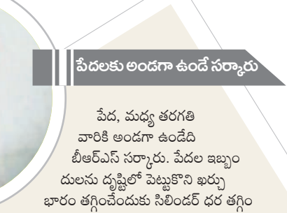
పేదలకు అందగా ఉండే సర్కారు

-విశ్వానర్ దానిబాయి, సర్రోనిపల్లి తండ్రా, నవాబ్ పేట