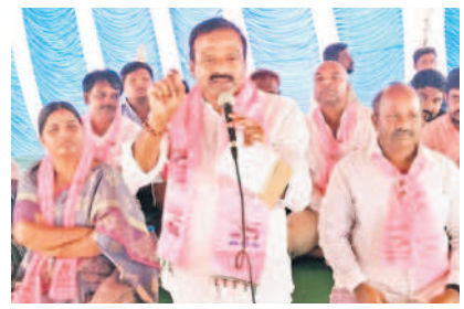
సమావేశంలో మాట్లాడుతున్న ఎమ్మెల్యే ఆల