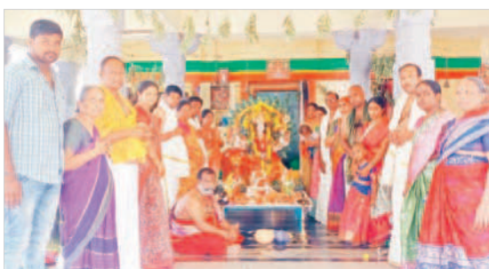
మదనాపురం పెద్దమ్మవారి శాలలో పూజలో పాల్గొన్న భక్తులు

దేవరకర్త, అక్టోబర్ 21 : మండల కేంద్రంలోని పోవమ్మ దేవస్థానం వద్ద దుర్గామాత భక్తులకు శనివారం లలితాత్రిపుర సుందరీదేవిగా దర్శనమిచ్చారు. అలాగే మండల కేంద్రంలోని పోవమ్మ దేవస్థానం, కన్యకాపరమేశ్వరి ఆలయంతోపాటు అంబేద్కర్ కాలనీ, చౌదర్పల్లి, గోపన్పల్లి, లక్ష్మీపల్లి, వెంకటయ్యపల్లి, చిన్నరాజమూర్తి తదితర గ్రామాల్లో దుర్గాదేవి అమ్మవారు శనివారం భక్తులకు సరస్వతీ మాత అలంకరణలో దర్శనమిచ్చారు.