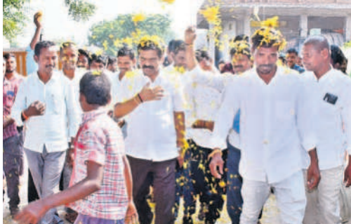
ఎమ్మెల్యే చిట్టంకు పూలతో స్వాగతం పలుకుతున్న నేతలు