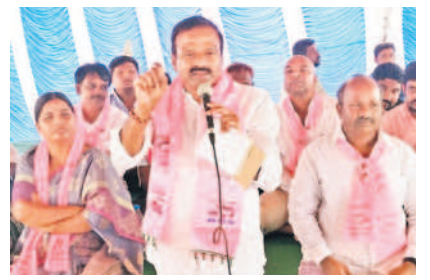
సమావేశంలో మాట్లాడుతున్న ఎమ్మెల్యే ఆల