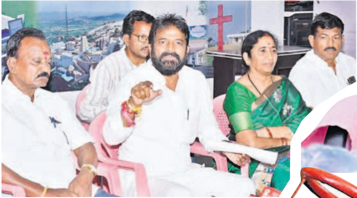
విలేకరులతో మాట్లాడుతున్న మంత్రి శ్రీనివాస్ గౌడ్