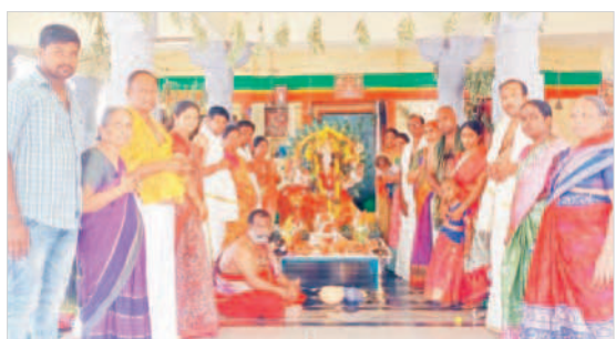
మదనాపురం పెద్దమ్మవారి శాలలో పూజలో పాల్గొన్న భక్తులు

దేవరకర్త, అక్టోబర్ 21 : మండల కేంద్రంలోని పోవమ్మ దేవస్థానం వద్ద దుర్గామాత భక్తులకు శనివారం లలితాత్రిపుర సుందరీదేవిగా దర్శనమిచ్చారు. అలాగే మండల కేంద్రంలోని పోవమ్మ దేవస్థానం, కన్యకాపరమేశ్వరీ ఆలయంతోపాటు అంబేద్కర్ కాలనీ, చౌదర్ పల్లి, గోపనపల్లి, లక్ష్మీపల్లి, వెంకటయ్యపల్లి, చిన్నరాజమూర్తి తదితర గ్రామాల్లో దుర్గాదేవి అమ్మవారు శనివారం భక్తులకు సరస్వతీ మాత అలంకరణలో దర్శనమిచ్చారు.