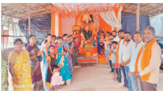
దేవరకర్త: అమ్మవారిని దర్శించుకుంటున్న భక్తులు