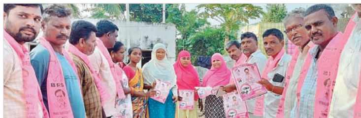
మదనాపురం: రామనాథుడు గ్రామంలో ఎన్నికల ప్రచారం నిర్వహిస్తున్న బీఆర్ఎస్ నాయకులు

భూత్పూర్, అక్టోబర్ 21 : బీఆర్ఎస్ నాయకులు మండలంలోని అన్ని గ్రామాల్లో శనివారం