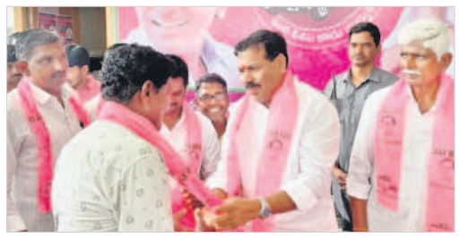
కందువా కప్పి పార్టీలోకి ఆహ్వానిస్తున్న ఎమ్మెల్యే బీరం హర్షవర్ధన్ రెడ్డి