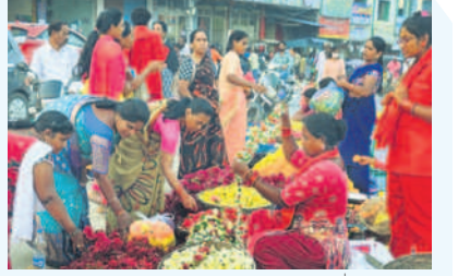
నల్లగొండ క్లాక్ టవర్ సెంటర్లో పూలు కొనుగోలు చేస్తున్న మహిళలు

మన సాంస్కృతిక ప్రతిబింబం.. తొమ్మిది రోజుల పండుగలో చివరి రోజైన సీడ్ల బతుకమ్మను ఆదివారం జరుపుకొనేందుకు ఆడబిడ్డలు సిద్ధమవుతున్నారు. జిల్లావ్యాప్తంగా శనివారం నుంచే పెద్ద బతుకమ్మను పేర్చేందుకు పూలు కొనుగోలు చేస్తూ కనిపించారు. మరోవైపు ప్రజలు కుటుంబ సమేతంగా దసరా పాకింగ్ చేస్తుండడంతో మార్కెట్లో సందడి నెలకొంది. పండుగ కోసమని పట్నం నుంచి పల్లె బాట పట్టిన ప్రజలతో జాతీయ రహదారులపై వాహన రద్దీ కనిపించింది. ఆర్టీసీ బస్టాండ్లు కిటకిటలాడాయి.