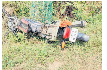
ప్రమాదంలో దెబ్బతిన్న బైక్

వ్యక్తి మృతి చెందిన ఘటన మండలంలోని పెద్దనాగారం సమీపంలో జాతీయ రహదారిపై శనివారం జరిగింది. ఎస్సై జీ సతీష్ తెలిపిన వివరాల ప్రకారం.. జాతీయ రహదారిపై తెల్లవారు జామున నడుచుకుంటూ వెళ్తున్న