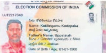
కోడెపాక కోటిలింగం, పద్మ ఓటర్ ఐడీ కార్డుల్లో జన్మదినం తప్పగా ముద్రించిన భారత ఎలక్షన్ కమిషన్

కార్యాలయంలో నెల రోజుల క్రితం ఫిర్యాదు చేశామని శనివారం ఆ దంపతులు చెప్పారు. అయిననూ అధికారులు పట్టించుకోవడం లేదని, ఇప్పటికైనా సరిచేయాలని వేడుకున్నారు.