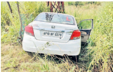
ప్రమాదానికి కారణమైన కారు