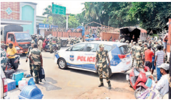
కాజీపేట రైల్వేస్టేషన్ వద్ద కేంద్ర పోలీస్ బలగాలు