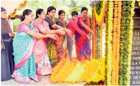
పోలీసు అమరవీరుల స్తూపం వద్ద శ్రద్ధాంజలి ఘటించుతున్న కుటుంబ సభ్యులు