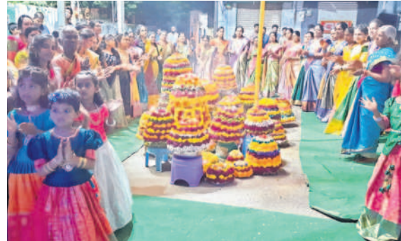
మంచిర్యాల భగవంతుని గర్భంలో బతుకమ్మ ఆడుతున్న మహిళలు