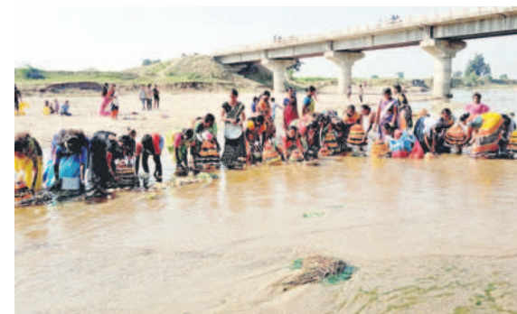
బెజ్జూర్ : కుకుడ వాగులో బతుకమ్మలను నిమజ్జనం చేస్తున్న మహిళలు