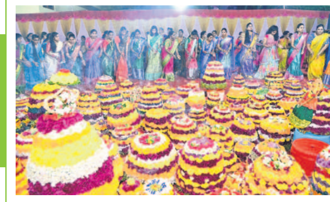
మంచిర్యాల రెడ్డికాలనీలో బతుకమ్మ ఆడుతున్న మహిళలు