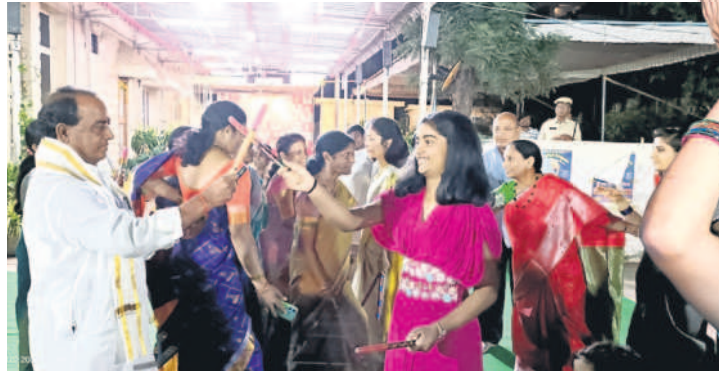
నిర్మల్ అర్బన్ : తమ నివాసంలో చిన్నారి తో కలిసి బతుకమ్మ ఆడుతున్న మంత్రి అర్జున్ ఇంద్రకరణ్ రెడ్డి