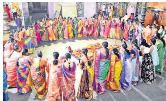
మంచిర్యాల విశ్వనాథ స్వామి దేవస్థానంలో బతుకమ్మ ఆడుతున్న మహిళలు