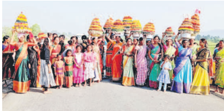
బెజ్జూర్ : కుకుడ వాగు వంతెన పై నెత్తిన బతుకమ్మలతో యువతులు, మహిళలు