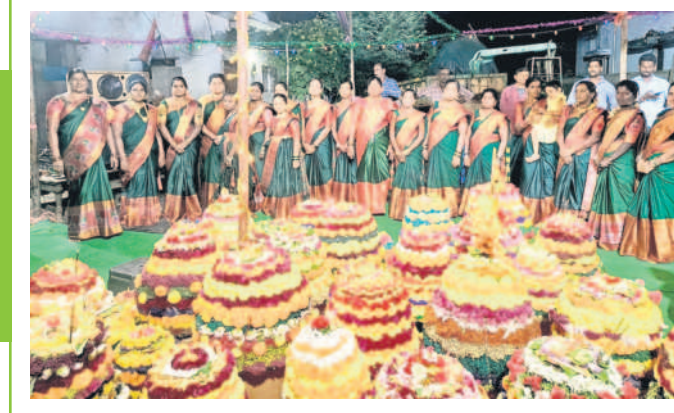
చెన్నూర్ రూరల్ : బలిజవాడలో బతుకమ్మ ఆడుతున్న మహిళలు