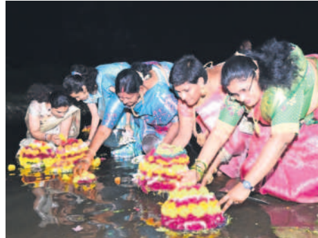
రాళ్లవాగులో బతుకమ్మలను నిమజ్జనం చేస్తున్న మహిళలు