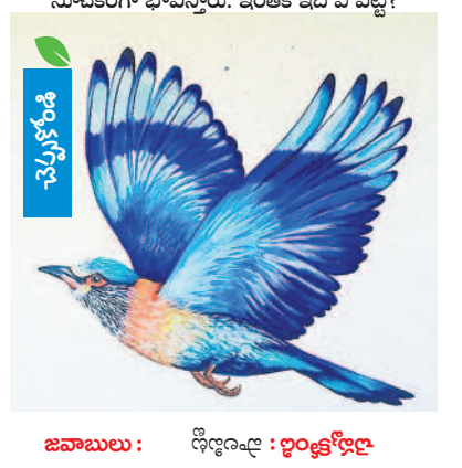
జవాబులు : శిల్పం : లక్ష్మణ్ శర్మ

దసరా పండుగ రోజున ఈ పిట్టను చూడటం కుభ సూచకంగా భావిస్తారు. ఇంతకీ ఇది ఏ పిట్ట?