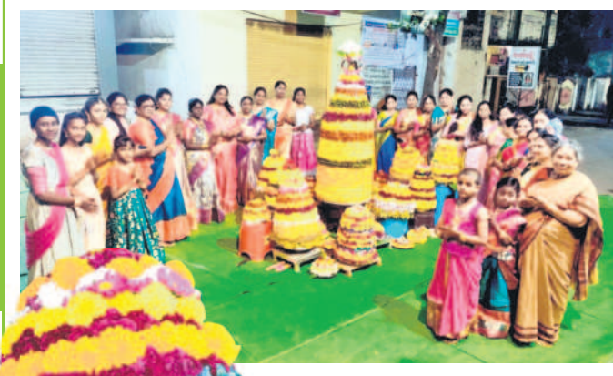
అసిఫాబాద్ : జిల్లా కేంద్రంలోని పోలీస్ ఠాణెం వద్ద బతుకమ్మ ఆడుతున్న మహిళలు