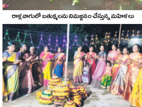
అసిఫాబాద్ : కుత్తుం భీం అసిఫాబాద్ జిల్లా కేంద్రంలోని జన్నాపూర్ లో..