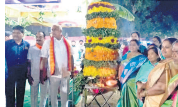
ఎస్సీఎం మైదానంలో బతుకమ్మకు పూజలు చేస్తున్న ఎమ్మెల్యే కోనేరు దండేపల్లి