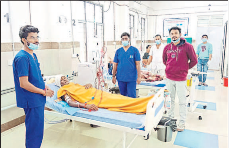
రోగులను పరిశీలిస్తున్న సిబ్బంది

ఉత్పూర్, అక్టోబర్ 22: మానవ శరీరంలో కిడ్నీల పాత్ర కీలకం. చెడు రక్తాన్ని శుద్ధి చేసి ప్రతి అవయవానికి పంపడం విధి. దీనికి బికిత్స అనేది అతి ఖరీదైనది. కచ్చితంగా డయాలసిస్ చేసుకోవాలి. లేకపోతే ప్రమాదాన్ని కొని తెచ్చుకున్నట్టే. ఇటు