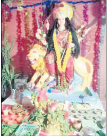
భోంపూర్ లో కొలువుదిన దుర్గాదేవి

చెన్నూర్ టౌన్, అక్టోబర్ 22 : దసరా.. హిందువుల ముఖ్యమైన పండుగ. ఆశ్వయుజ శుద్ధ పాడ్యమి నుంచి ఆశ్వయుజ శుద్ధ నవమి వరకు 9 రోజులు దేవి నవరాత్రులు. పద్మో రోజు విజయదశమి కలిసి దసరా అంటారు. ఇది ముఖ్యంగా శక్తి ఆరాధనకు ప్రాధాన్యత ఇచ్చే పండుగ. దీనిని నవరాత్రి, శరన్నవరాత్రి అని అంటారు. శరద్ృతువు ఆరంభంలో వచ్చే పండుగ కాబట్టి ఈ పేరు వచ్చింది. కొందరు ఈ పండుగను మొదటి మూడు రోజులు పార్వతీ దేవికి, తర్వాత లక్ష్మీదేవికి, తర్వాత మూడు రోజులు సరస్వతీ దేవికి పూజలు నిర్వహిస్తారు. అలాగే ఆలయాల్లో అమ్మవారిని ఒక్కో రోజు ఒక్కో ఆలంకారం చేస్తారు. తెలుగువారు దసరాను 10 రోజులు జరుపుకుంటారు. తెలంగాణలో 9 రోజులు అమావాస్య నుంచి నవమి వరకు బతుకమ్మ ఆడతారు. పలు చోట్ల రావణాసుర దహనం పేరిట 'రామ్ లీల' నిర్వహిస్తుంటారు. ఈ యేడాది మంచినీటి జిల్లాలో 23వ తేదీ సోమవారం విజయదశమి నిర్వహించనున్నారు.