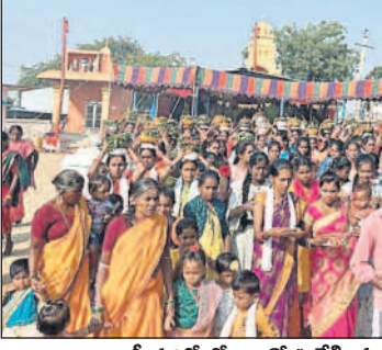
పీచరలో బోనాలతో ఊరేగింపుగా వెళ్తున్న భక్తులు