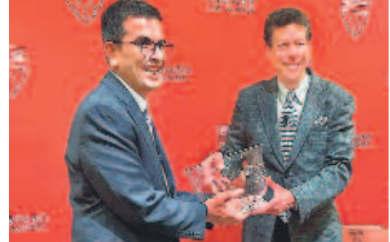
గ్లోబల్ లీడర్షిప్ పురస్కారం స్వీకరిస్తున్న జస్టిస్ డీప్ చంద్రమౌడ

కేంద్ర ప్రభుత్వం పథకాల ప్రచారానికి సైనికులను, అధికారులను వాడుకోవడంపై వివక్షలు ఆగ్రహం వ్యక్తం చేస్తున్నాయి. అధికారులతో ప్రచారం నిర్వహించడం బ్యూరోక్రసీని రాజకీయకరణ చేయడమేనని కాంగ్రెస్ అధ్యక్షుడు మల్లికార్జున్ ఖాన్ అరోపించారు. వెంటనే ఈ నిర్ణయాన్ని ఉపసంహరించుకోవాలని డిమాండ్ చేశారు. ఈ మేరకు ఆయన ఆదివారం ప్రధాని మోదీకి లేఖ రాశారు. కేంద్ర సీఎల్ సర్వీసుల (ప్రవర్తన) నియామకం-1964 ప్రకారం ప్రభుత్వ ఉద్యోగులైనవారు ఏ రాజకీయ కార్యక్రమంలో పాల్గొనకూడదని.. కేంద్రం రాష్ట్రాలకు చెందినవారు రాష్ట్రాలలో తిరుగుతారు. ఎన్డీయే ప్రభుత్వం గత తొమ్మిదేండ్లలో సాధించిన విజయాలను ప్రచారం చేస్తారు. ఈ యాత్రలో వివిధ కేంద్ర ప్రభుత్వ పథకాల లబ్ధిదారులను, లబ్ధిదారులు కాని వారిని వారు కలుస్తారు. ఈ నిర్ణయంపై తీవ్ర విమర్శలు వ్యక్తమవుతున్నాయి. ప్రభుత్వ యంత్రాంగాన్ని కేంద్రం దుర్వినియోగం