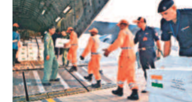
పాలస్తీనియన్లకు సహాయ సామగ్రి తరలిస్తున్న భారత్ సిబ్బంది

జెరూసలేం/గాజా సిటీ, అక్టోబర్ 22: హమాస్ తో యుద్ధంలో భాగంగా గాజా స్ట్రీట్లపై దాడులను మరింత తీవ్రతరం చేస్తామని ఇజ్రాయెల్ సైన్యం వెల్లడించింది. యుద్ధాన్ని తదుపరి దశకు తీసుకెళ్లడం అనుకూల పరిస్థితులు సృష్టించకపోతే లక్ష్యంగా పెట్టుకోవచ్చు అని అధికార ప్రతినిధి డేవియల్ హగార్ తాజాగా వెల్లడించారు. హమాస్ మిలిటెంట్ల నుంచి తమ బలగా లకు ముప్పు ఎదురవుతుందా తగిన ప్రణాళికలు అనుసరిస్తామని పేర్కొన్నారు. గాజా సిటీలోని పౌరులను దక్షిణ గాజాలోకి వెళ్లమంటూ ఆయన మరోసారి పిలుపునిచ్చారు. ఇప్పటి వరకు గాజాపై వైమానిక దాడులు చేస్తున్న ఇజ్రాయెల్.. హమాస్ ను పూర్తిగా నాశనం చేసే లక్ష్యంతో తదుపరి భూతల దాడులు చేపట్టాలని మాన్య ప్రకటించారు. అందులో భాగంగా ప్రస్తుతం రెండో దశ దాడులకు సిద్ధమవుతున్నట్లు తెలుస్తున్నది. సిరియా విమానాశయాల్పై మరోసారి దాడులు