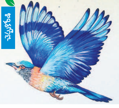
జవాబులు : ఢిల్లీ : ఢిల్లీ : ఢిల్లీ

దసరా పండుగ రోజున ఈ పిట్టను చూడటం శుభ సూచకంగా భావిస్తారు. ఇంతటి ఇది ఏ పిట్ట?