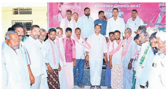
ఎమ్మెల్యే బండ్ల కృష్ణమోహన్ రెడ్డి సమక్షంలో బీఆర్ఎస్ లో చేరుతున్న కేటీడొడ్డికి చెందిన కాంగ్రెస్, బీజేపీ నాయకులు