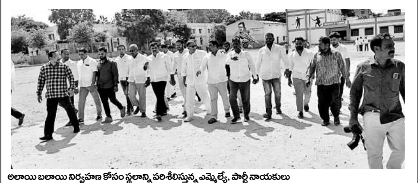
అలాయి బలాయి నిర్వహణ కోసం స్థలాన్ని పరిశీలిస్తున్న ఎమ్మెల్యే, పార్టీ నాయకులు