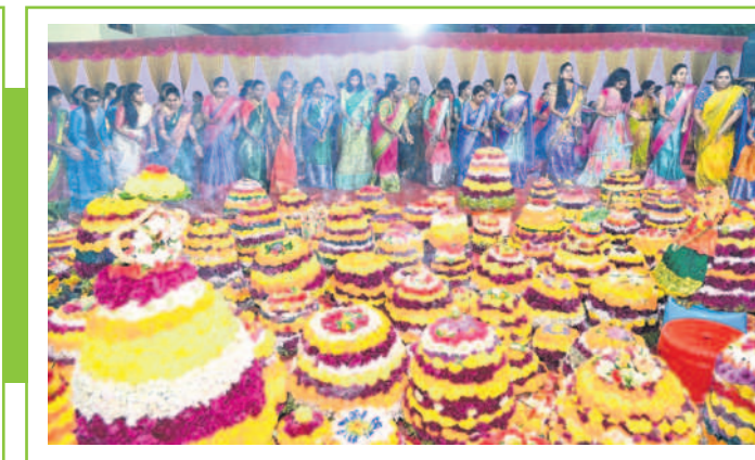
మంచిర్యాల రెడ్డి కాలనీలో బతుకమ్మ ఆడుతున్న మహిళలు