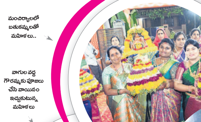
మంచిర్యాలలో బతుకమ్మలతో మహిళలు..

బెజ్జూర్: కుకుడ వాగు వంతెనపై నెత్తిన బతుకమ్మలతో యువతులు, మహిళలు