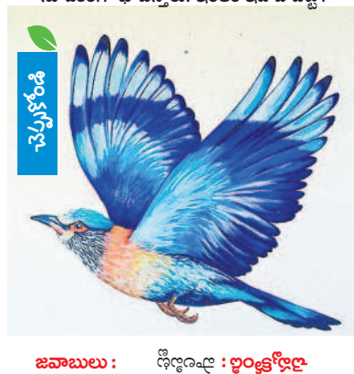
దసరా పండుగ రోజున ఈ పిట్టను చూడటం శుభ సూచకంగా భావిస్తారు. ఇంతకీ ఇది ఏ పిట్ట? జవాబులు: ఢిల్లీ: ధృవోద్ధర