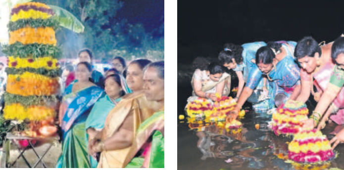
ఎన్టీఆర్ మైదానంలో బతుకమ్మకు పూజలు చేస్తున్న ఎమ్మెల్యే కోనేరు దంపతులు