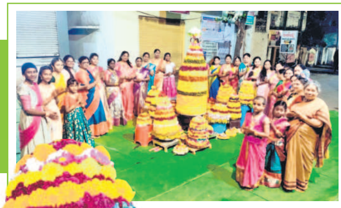
అసిఫాబాద్: జిల్లా కేంద్రంలోని పోట్లీశ్రీ రాములు చౌక్ వద్ద బతుకమ్మ ఆడుతున్న మహిళలు