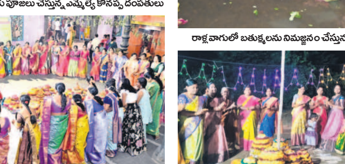
అసిఫాబాద్: కుప్రం టీం అసిఫాబాద్ జిల్లా కేంద్రంలోని జన్మాపూర్లో..