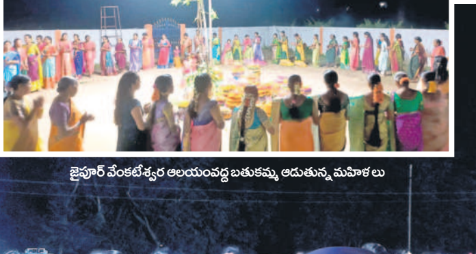
జైపూర్ వేంకటేశ్వర ఆలయం వద్ద బతుకమ్మ ఆడుతున్న మహిళలు