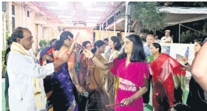
నిర్మల్ అర్బన్: తమ నివాసంలో చిన్నారులతో కోలాటం ఆడుతున్న మంత్రి అల్లెల ఇంద్రకణ్ణి రెడ్డి