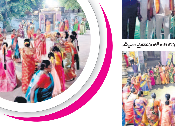
మంచిర్యాల విశ్వనాథ స్వామి దేవస్థానంలో బతుకమ్మ ఆడుతున్న మహిళలు