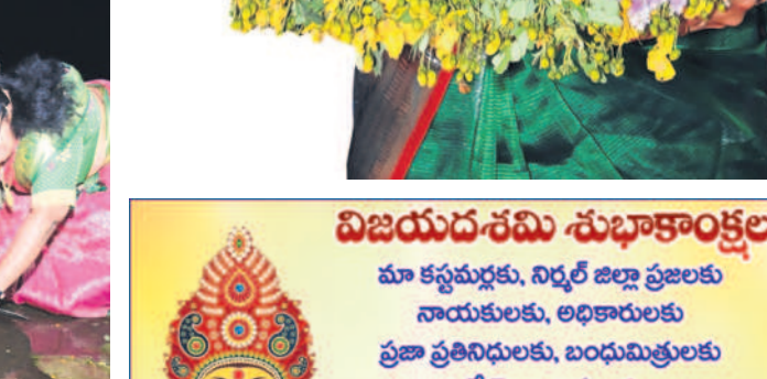
రాళ్ల వాగులో బతుకమ్మలను నిమజ్జనం చేస్తున్న మహిళలు