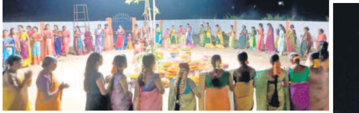
జైపూర్ వేంకటేశ్వర ఆలయం వద్ద బతుకమ్మ ఆడుతున్న మహిళలు