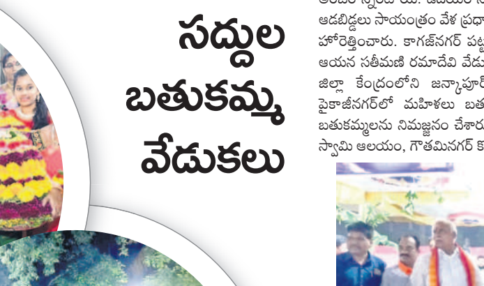
వాగు వద్ద గౌరమ్మ పూజలు చేసే వాయిదా ఇచ్చుకుంటున్న మహిళలు