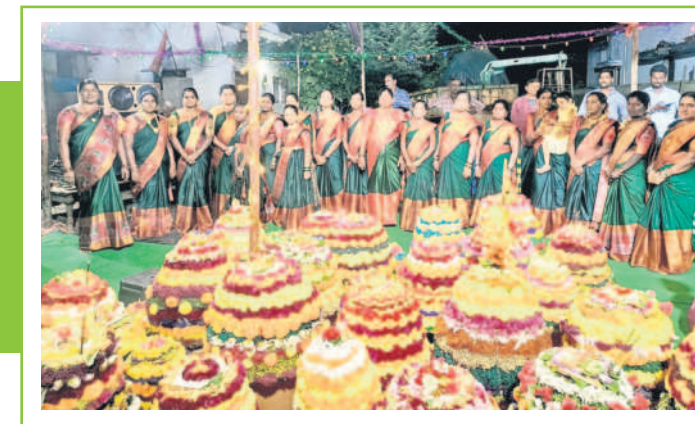
చెన్నూర్ రూరల్: బలిజవాడలో బతుకమ్మ ఆడుతున్న మహిళలు