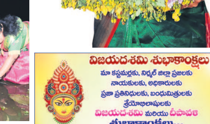
రాళ్ల వాగులో బతుకమ్మలను నిమజ్జనం చేస్తున్న మహిళలు