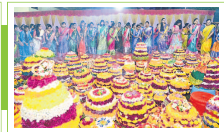
మంచిర్యాల రెడ్డి కాలనీలో బతుకమ్మ ఆడుతున్న మహిళలు