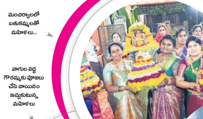
మంచిర్యాలలో బతుకమ్మలతో మహిళలు..