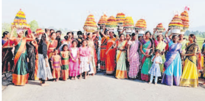
బెజ్జూర్: కుకుడ వాగు వంతెనపై నెత్తిన బతుకమ్మలతో యువతులు, మహిళలు