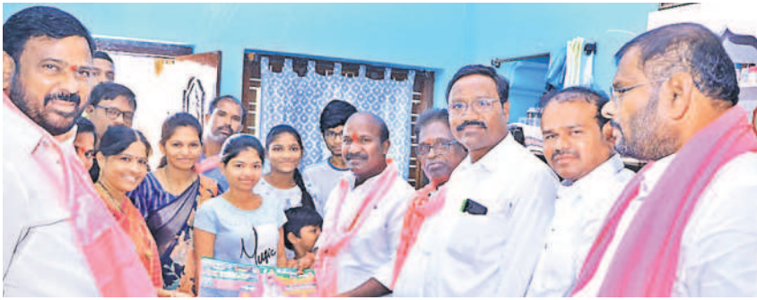
నార్కట్పల్లి పట్టణంలోని 2వ వార్డులో ఓటు అభ్యర్థిస్తున్న ఎమ్మెల్యే చిరుమర్తి లింగయ్య