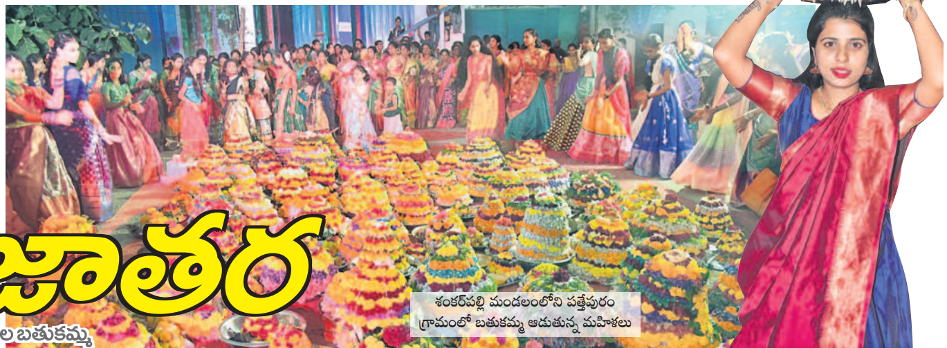
శంకర్ పల్లి మండలంలోని పత్తేపురం గ్రామంలో బతుకమ్మ ఆడుతున్న మహిళలు