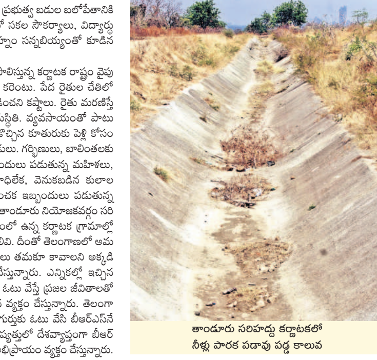
తాండూరు సరిహద్దు కర్ణాటకలో నీళ్లు పారక పదావు పథ్ కాలవ