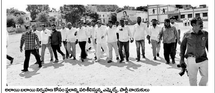
అలాయి బలాయి నిర్వహణ కోసం స్థలాన్ని పరిశీలిస్తున్న ఎమ్మెల్యే, పార్టీ నాయకులు