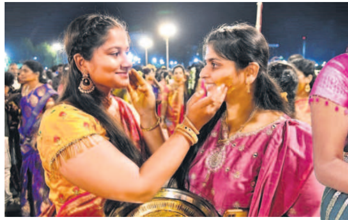
సిద్దిపేట కోమటి చెరువు మీసీ ట్యాంక్ బండ్ పై వాయిసం ఇచ్చిపుచ్చుకుంటున్న మహిళలు