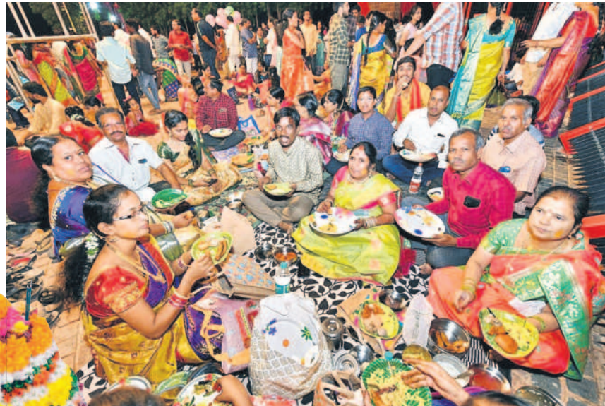
సిద్దిపేట కోమటిచెరువు మీసీ ట్యాంక్ బండ్ పై ప్రసాదాలు తింటున్న మహిళలు, వారి కుటుంబీకులు