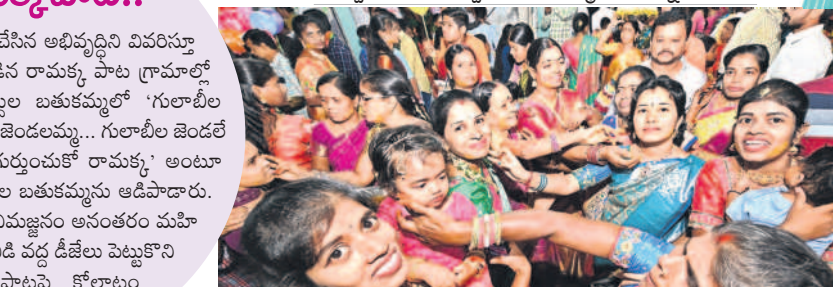
సిద్దిపేటలో వాయిసం ఇచ్చిపుచ్చుకుంటున్న మహిళలు