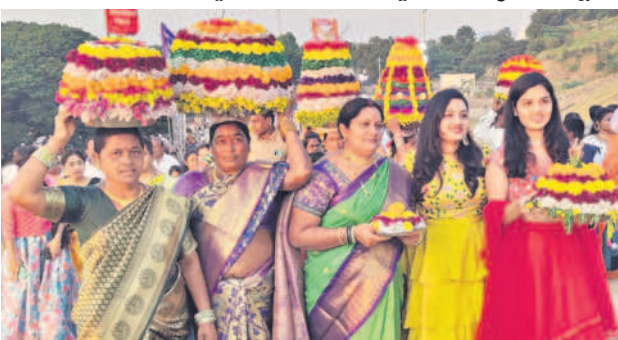
హుస్సాబాద్ లో భారీ బతుకమ్మలతో ఎల్లమ్మ చెరువు కట్టపైకి వస్తున్న మహిళలు