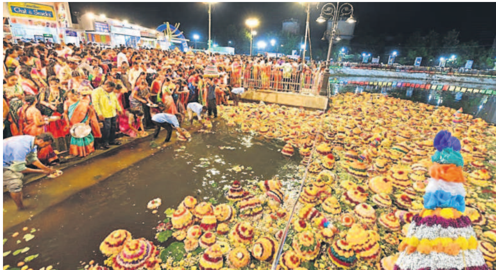
సిద్దిపేట కోమటిచెరువులో బతుకమ్మలను నిమజ్జనం చేస్తున్న మహిళలు