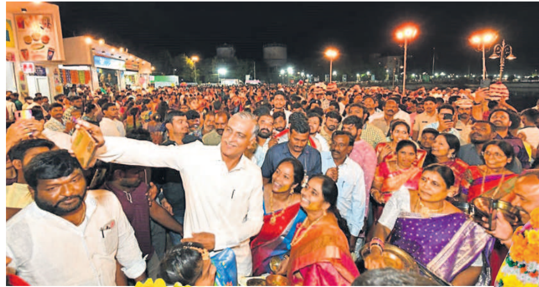
సిద్దిపేట కోమటిచెరువు మీసీ ట్యాంక్ బండ్ పై మంత్రి హరిశ్చంద్ర సతీమణి సుకుమార్ ప్రజలు