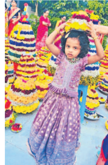
సిద్దిపేటలో నిర్వహించిన బతుకమ్మ సంబురాలలో చిన్నారి, యువతి