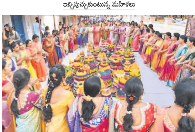
సిద్దిపేటలో బతుకమ్మ ఆడుతున్న మహిళలు