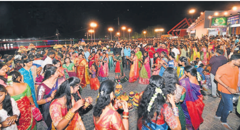
సిద్దిపేట కోమటి చెరువు కట్టపై బతుకమ్మ ఆడుతున్న మహిళలు

సిద్దిపేట, అక్టోబర్ 22 (నమస్తే తెలంగాణ ప్రతినిధి): తెలంగాణ సంస్కృతి వైభవానికి ప్రతీక, తెలంగాణలో అతి పెద్ద పండుగ బతుకమ్మ. ఇది ఆడపడుల పండుగ, ఎంగిలిపూలతో ప్రారంభమైన బతుకమ్మ తో మిగిలిన రోజు సద్దుల బతుకమ్మ ఆదివారం ముగిసింది. చిన్నా పెద్దా అనే తేడా లేకుండా సద్దుల బతుకమ్మ సంబరం అంబరాన్నంటింది. ఆడవికి, మార్కెట్టుకు వేళ్ళి వివిధ రకాల పూలను తీసుకొచ్చి ఇంటిల్లిపాది బతుకమ్మలను పేర్చారు. పేర్చిన బతుకమ్మలను గ్రామ, పట్టణ చావీడిలు చెరువుగట్ట వద్ద సాయంత్రం పెట్టి ఆడారు. మహిళలు సూతన పన్నాలు ధరించి, మెడలో నగలతో ముస్తాబై పూలతో పేర్చిన బతుకమ్మను గాజుల గలగల వాయిద్యాలూగా మలిచి పల్లవికి శృతి కలుపుతూ అయిబద్ధంగా అడుగులు వేస్తూ... బతుకమ్మ బతుకమ్మ ఉయ్యాలో... బంగారు బతుకమ్మ ఉయ్యాలో... అంటూ తీరకృష్ణ పాటలు పాడుతూ ఆడారు. జిల్లాలోని ప్రధాన పట్టణాలతో పాటు మండల కేంద్రాలు, వివిధ గ్రామాల్లో సద్దుల బతుకమ్మ ఘనంగా ముగిసింది. సిద్దిపేట, గజ్జెల్, దుబ్బాక, హుస్సాబాద్, చేర్కూరు తదితర పట్టణ ప్రాంతాల్లో సద్దుల బతుకమ్మ సంబురాలు అంబరాన్నంటాయి. సిద్దిపేటలో మీసీ ట్యాంక్ బండ్ గా మారిన కోమటి చెరువు ప్రాంగణమంతా పూలపరేడ్ మురిసింది. జిల్లా ప్రజలంతా సంతోషంగా పండగ జరుపుకొన్నారు. చెరువు కట్టల వద్ద ప్రభుత్వం ట్రైటింగ్ ఏర్పాటు చేసింది. బతుకమ్మలు నిమజ్జనం చేసే చెరువు లకు ప్రత్యేకంగా బతుకమ్మ మెట్లను రంగులతో అలంకరించారు. సాంస్కృతిక కార్యక్రమాల ఏర్పాటు చేశారు. చెరువు కట్టలు విద్యుత్ దీపాల కాంతులతో వెలిగి పోయాయి. ఇలా అన్ని చెరువు కట్టలు విద్యుత్ వెలుగులతో జగలుమన్నాయి. అయిన నియోజకవర్గ కేంద్రాల్లో జరిగిన సద్దుల బతుకమ్మ వేడుకల్లో స్థానిక ప్రజాప్రతినిధులు, అధికారులు పాల్గొన్నారు.