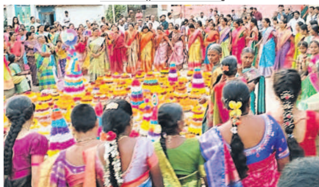
సిద్దిపేట రూరల్: ఇర్లపల్లెలో బతుకమ్మ ఆడుతున్న మహిళలు