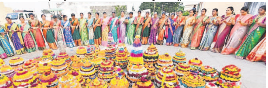
సిద్దిపేటలోని 15వ వార్డులో బతుకమ్మ ఆడుతున్న మహిళలు