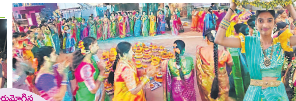
దుబ్బాక టౌన్: దుబ్బాకలో బతుకమ్మ ఆడుతున్న మహిళలు